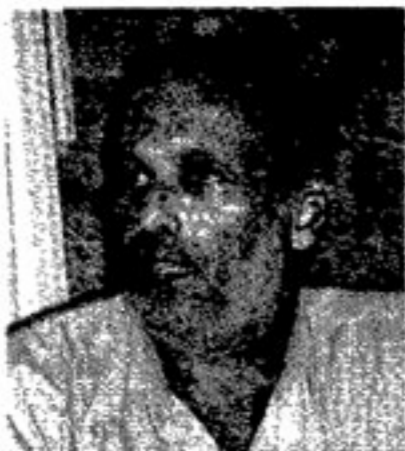
גליל התרגיל: תרוח

כביש 317 נמתח ממערב למזרח, לאורך הכטן הדרומית של הגדה. התוכנית המקורית של שרון, מאוקטובר 2003, הייתה להקים את גדר ההפרדה מצפון לכביש, ובכך לספח הלכה למעשה שורה של התנחלויות ואלפי רזנמים של ארמות מרעה למדינת ישראל. הממשל האמריקאי התנגד, בג"ץ פסק נגד,