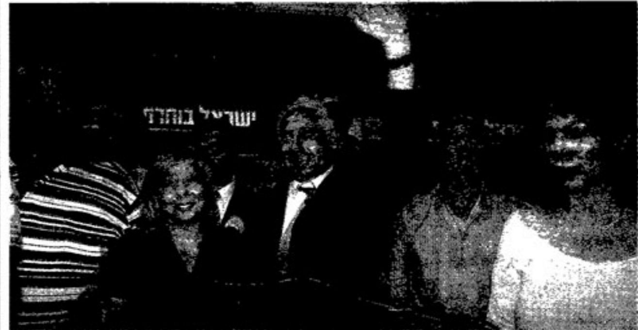
מצעי הניצחון: הזוג נתניהו, השבוע

עם זאת, גדר ההפרדה היא מפעל לאומי מוצלח ביותר. היא שווה כל שקל מ-13 מיליארד השקלים שהושקעו בה. היא שיפרה לאין ערוך את חייהם של מאות אלפי ישראלים, יהודים וערבים, שחיים לאורך קו התפר, וכפעם הראשונה מאז 1967 נתנה לישראלים גבול להתגדר בו. הייתה לה כנראה גם תרומה מסוימת