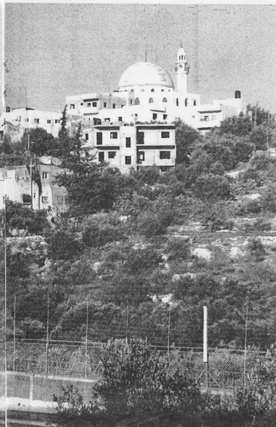
בית-ביתסירא, תמוס פמורס מהגדר הנובלת במכבים. הפלסטיני בנה רמפה ודילוג מעל הגדר. חברו חזר על עקבותיו